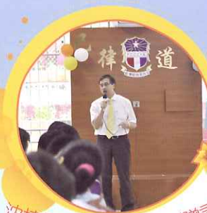
沈校長向畢業同學臨別贈言