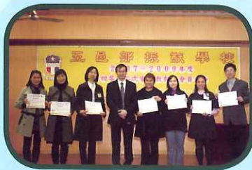
第四屆委員接受感謝狀