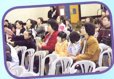
會員細心聆聽會務報告