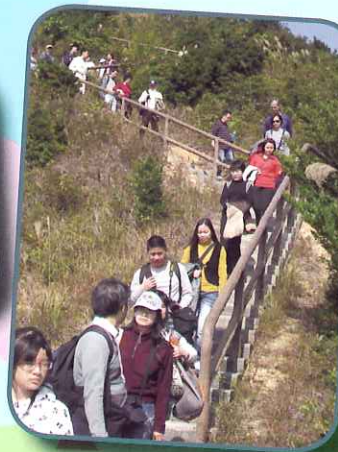
努力，努力！終點在望！