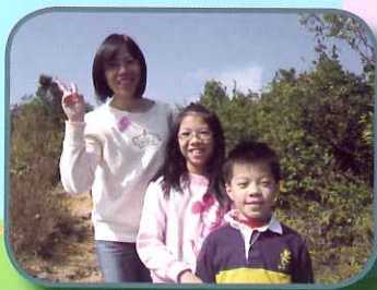
親子步行，樂也融融