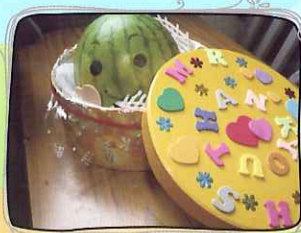
別出心裁的生果籃