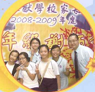
各位畢業生，恭喜！恭喜！