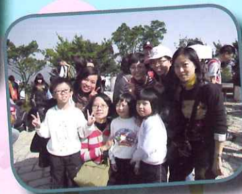
師生共聚，喜上眉梢