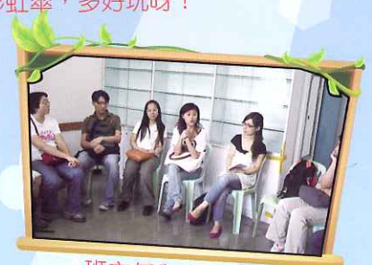
班主任與家長溝通