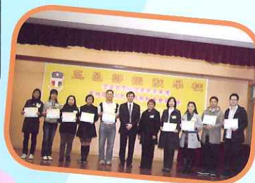
第五屆家長教師會誕生了！