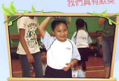
看！我的姿態多美妙！