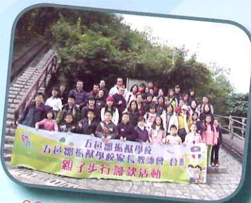
09-10年度親子行山活動