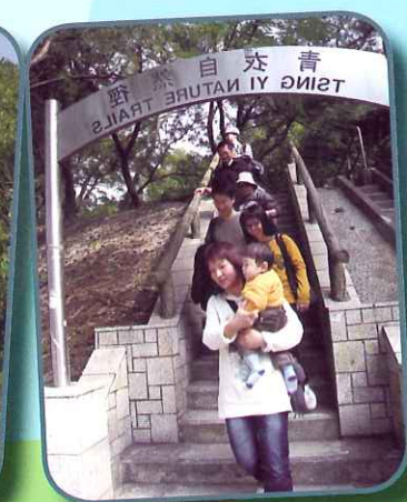
BB，我們完成步行籌款的創舉了！