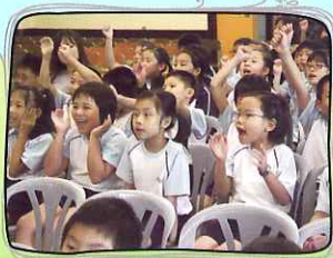
同學看得興高采烈