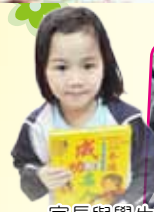
家長與學生齊來選購圖書

本會於 12 月及 5 月舉辦家教會展銷及義賣，活動除可為家教會籌募經費外，更方便家長及學生購買圖書、多媒體學習材料、書包、皮鞋及健康食品等。是次活動深受家長歡迎，並為本會籌得一千多元的經費。