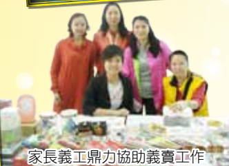
家長義工鼎力協助義賣工作