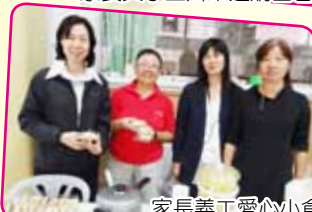
家長義工愛心小食，太美味了！