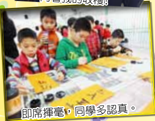
即席揮毫，同學多認真。