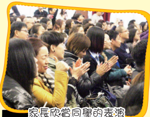
家長欣賞同學的表演