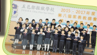
普通話集誦隊朗誦《給你》