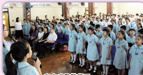
在合唱團帶領下，全體同學一同高歌《敬師頌》

學校十分重視「敬師日」，每年都會舉行敬師活動，目的是藉此機會讓同學向教師表達敬意。本年度敬師典禮於 13/9/2016(二) 舉行。當天，全體同學齊集禮堂，一同高唱《感師恩》和《敬師頌》，歌頌老師的無私付出。然後由學生代表上台致送敬師郵品及果醬給老師，場面溫馨。