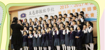
合唱團歌唱《學校樂趣多》