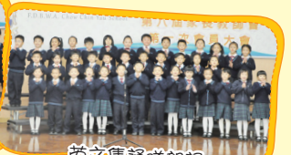
英文集誦隊朗誦 The Train Journey