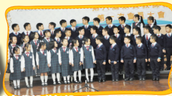
中文集誦隊朗誦《每天帶着它上街去》