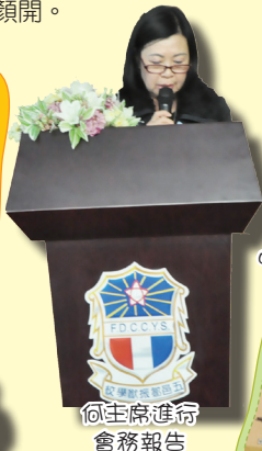
何主席進行會務報告